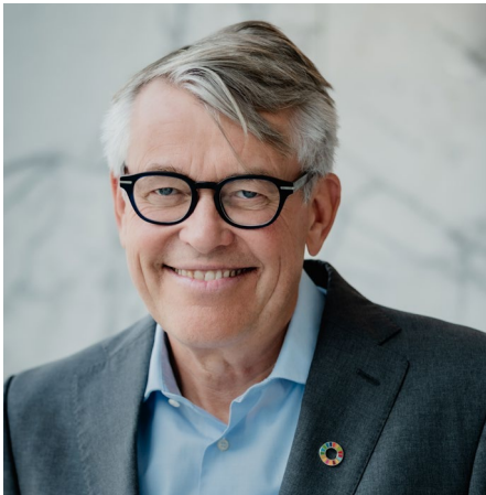
Reidar Gjærum Generalsekretær